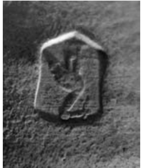
Detail van een aardbeienpotje bestemd voor Den Haag, voorzien van het gemeentewapen: de ooievaar.

wapen. Die voor Den Haag droegen het ook nu nog bekende gemeentelijke ooievaartje, alleen het voor Rotterdam bestemde potje was gewoon glad. Bijzonderheden over andere bestemmingen ontbreken. Voor een gaaf exemplaar wordt nu zo'n 175 gulden betaald.