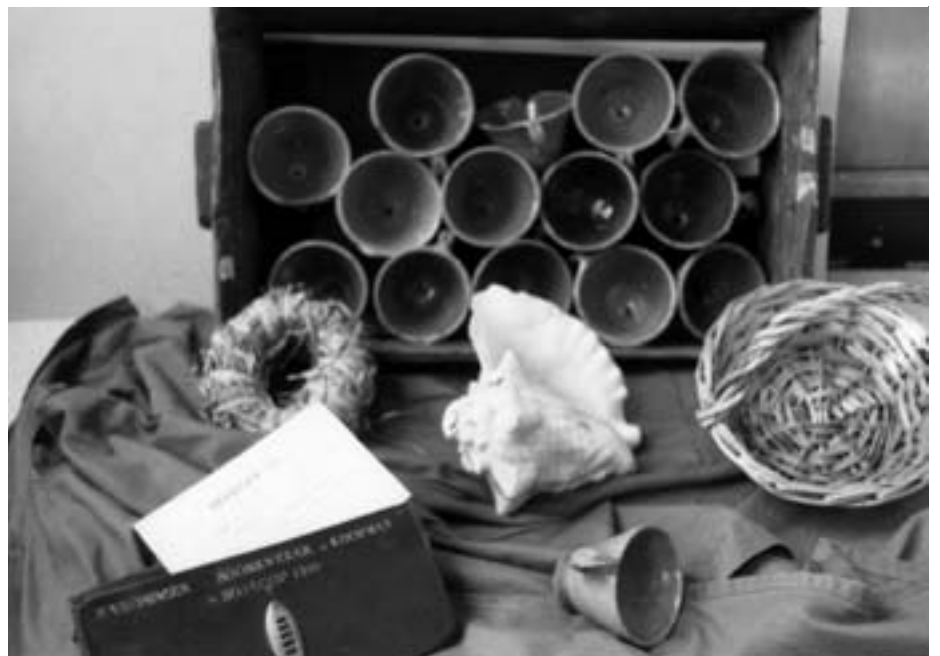
Een complete opstelling van materiaal in het Boomkwekerijmuseum. Een verzameling potjes, mandje, de kinhoren van een schipper en een kasboek waarin deze de administratie bijhield.

der Water een rijksdaalder met zijn nieuwigheid 'Reus van Zuidwijk', waarvan de Vereeniging tot Regeling en Verbetering der Vruchtsoorten de hele voorraad opkocht, maar uiteindelijk bleef succes uit.