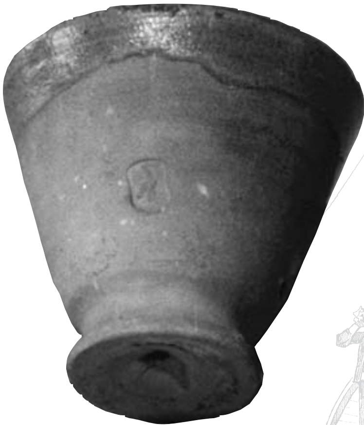
Het klassieke model aardbeienpotje. Goed te zien is dat de buitenzijde niet van een glazuurlaag is voorzien.

compagnie is in 1904 opgeheven. Jarenlang heeft de aardbeicultuur Boskoop bekendheid gegeven. Ook nadat ze verdwenen was kreeg het toenmalige hotel Klaassen in de zomer gasten die speciaal kwamen om aardbeien te eten. Het was bij de telers lang traditie geweest, in de oogsttijd familie en vrienden op hun producten te trakteren. Twee bordjes met daaraan herinnerende rijmpjes, gemaakt in opdracht van Klaas van Wilgen in 1760, bestemd voor een aardbeienmaaltijd, zijn nog in het Boomkwekerijmuseum te vinden.