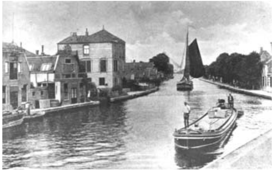
Op deze foto uit het begin van deze eeuw is de Voorkade te zien met een zeilboot in de Gouwe. Langs de Voorkade stonden toen nog kastanjabomen die later allemaal zijn verdwenen.

Dat de bebouwing langs de Gouwe heel oud moet zijn, blijkt uit het nog steeds bestaande en bewoonde 'schoutenhuis' (met de oranjeboom in de gevel), dat volgens de gevelsteen dateert uit 1686. In dit huis woonde destijds de Schout van Boskoop. De functie van schout is later vervangen door die van burgemeester. Het huis had vroeger wel een andere voorgevel. Bij de deur was namelijk een trap, zoals men die aantreft bij de grachtenhuizen in de grote steden. Als gevolg van verbreding van de Gouwe en ophoging van de Gouwekade was een verbouwing nodig waarbij de trap is