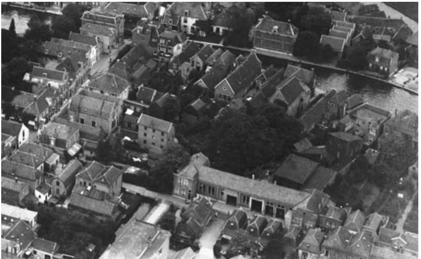
Detail van een luchtfoto die een deel van het centrum toont voor de komst van de hefbrug, die het centrum van Boskoop drastisch heeft gewijzigd. Op de voorgrond is de oude Nieuwstraat te zien met het toen al tot garage omgebouwde schoolgebouwtje. De foto geeft ook een goed beeld van de structuur die het centrum van Boskoop voortijds had.