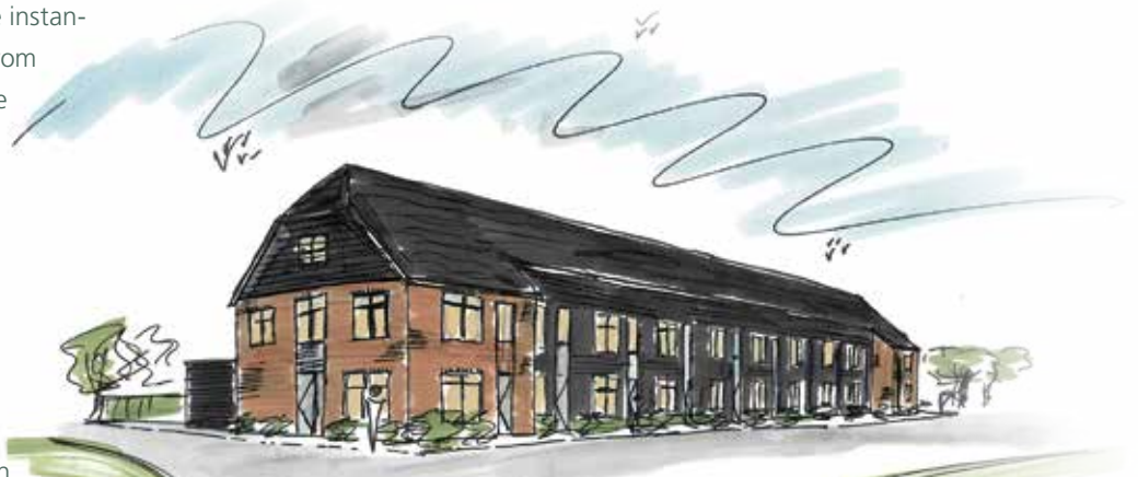
Impressie (concept) van 12 woningen Driekoppen in Noorden.

stellen die een gezinswoning zoeken én uit Noorden komen krijgen voor een deel voorrang. Als blijkt dat daarmee niet alle woningen worden verhuurd, maakt WSN de cirkel groter en geeft voorrang aan mensen uit de gemeente Nieuwkoop die een huurwoning achterlaten of daarna aan mensen uit Nieuwkoop in het algemeen.