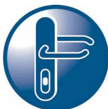
HANG- EN SLUITWERK