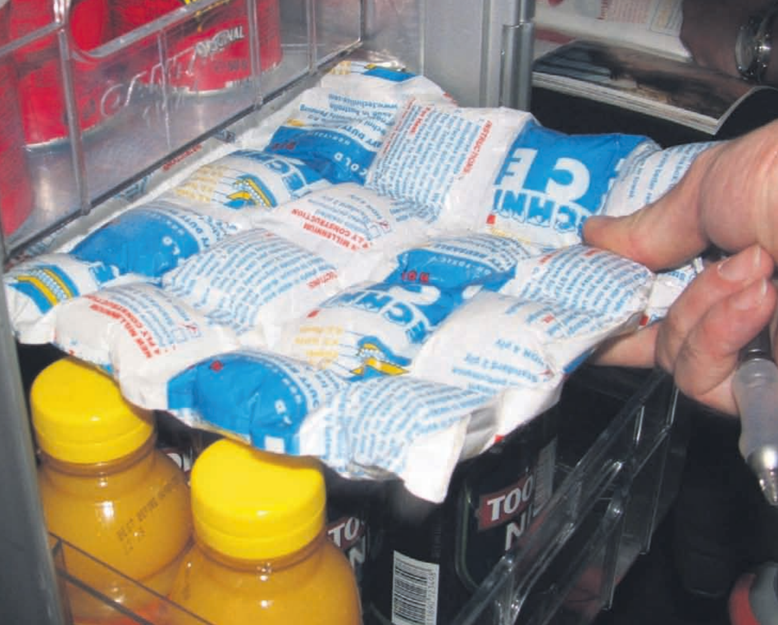
HDR 4 vellen in gebruik in een vliegtuigtrolle.