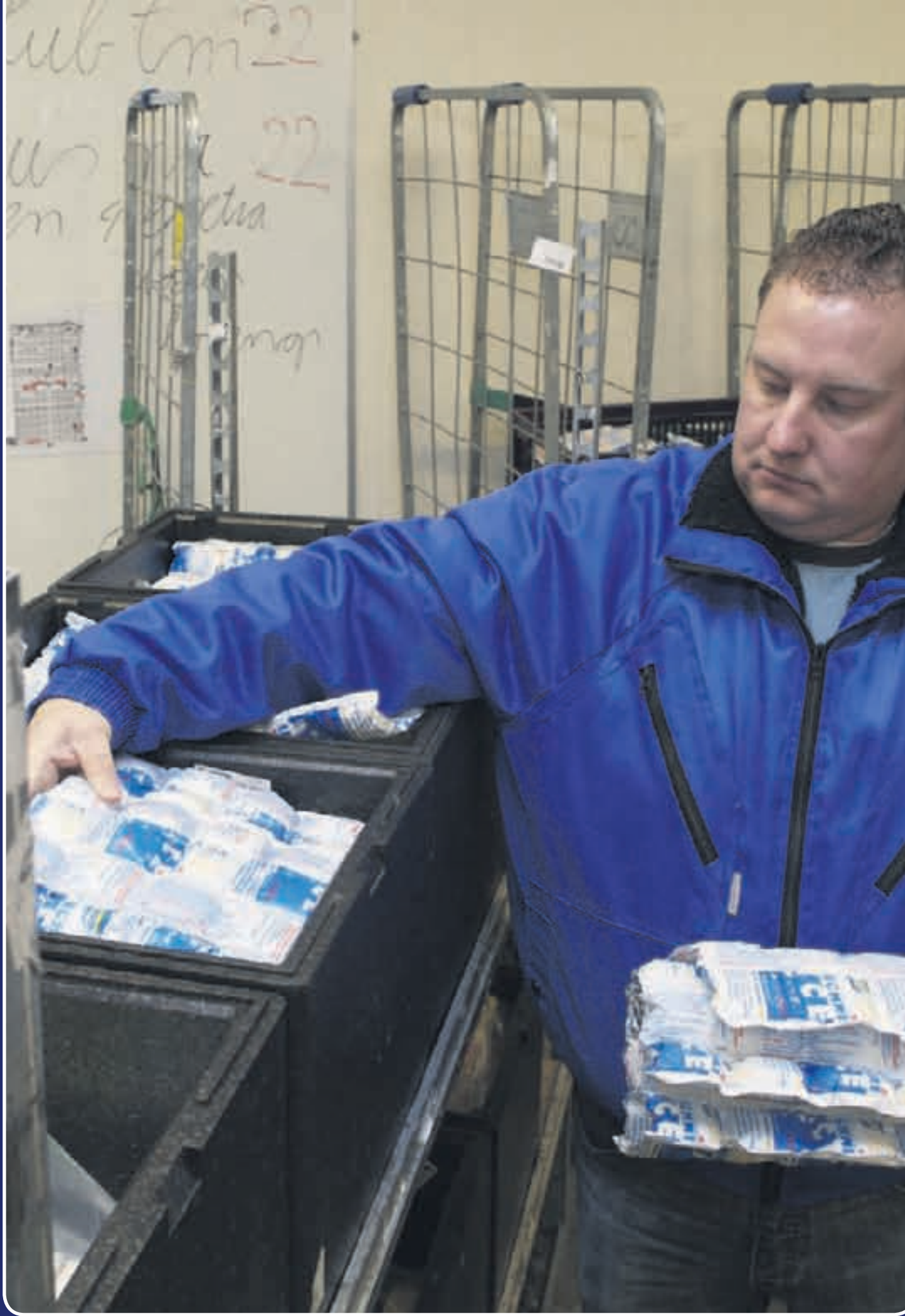
Albert.nl gebruikt Techni-Ice voor het vervoer van gekoelde en verse producten.